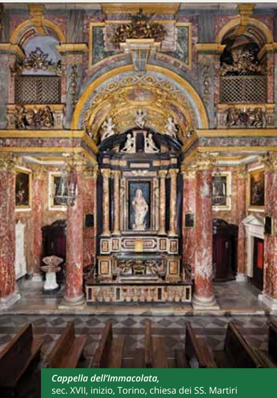
Cappella dell'Immacolata, sec. XVII, inizio, Torino, chiesa dei SS. Martiri