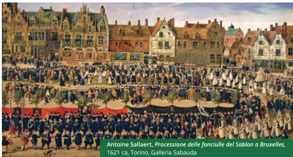
Antoine Sallaert, Processione delle fanciulle del Sablon a Bruxelles , 1621 ca, Torino, Galleria Sabauda

La Fondazione 1563 per l'Arte e la Cultura, ente strumentale della Compagnia di San Paolo, persegue statutariamente la realizzazione di attività di ricerca e di alta formazione nel campo delle discipline umanistiche. In particolare alla Fondazione sono affidate tutela, gestione e valorizzazione dell'Archivio Storico della Compagnia di San Paolo e la promozione di un articolato Programma di studi e ricerche sull'Età e la Cultura del Barocco.